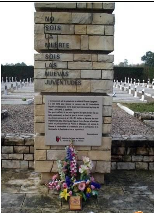
Cimetière des espagnols à Septfonds