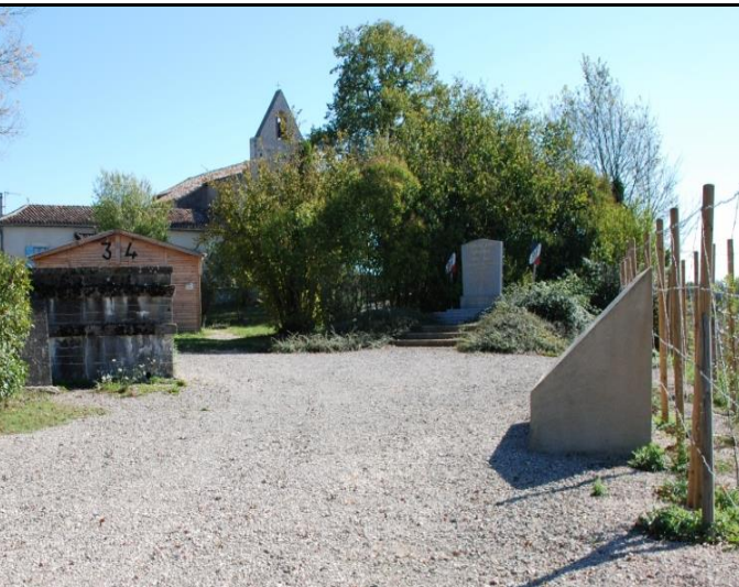
Le Camp de concentration de « Judes »