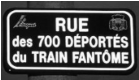
A Sorgues, plaque-souvenir du 18 août 1944, placée en 1998